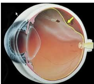
DESGARRO QUE PRODUCE PASO DE LÍQUIDO AL ESPACIO SUBRETINIANO