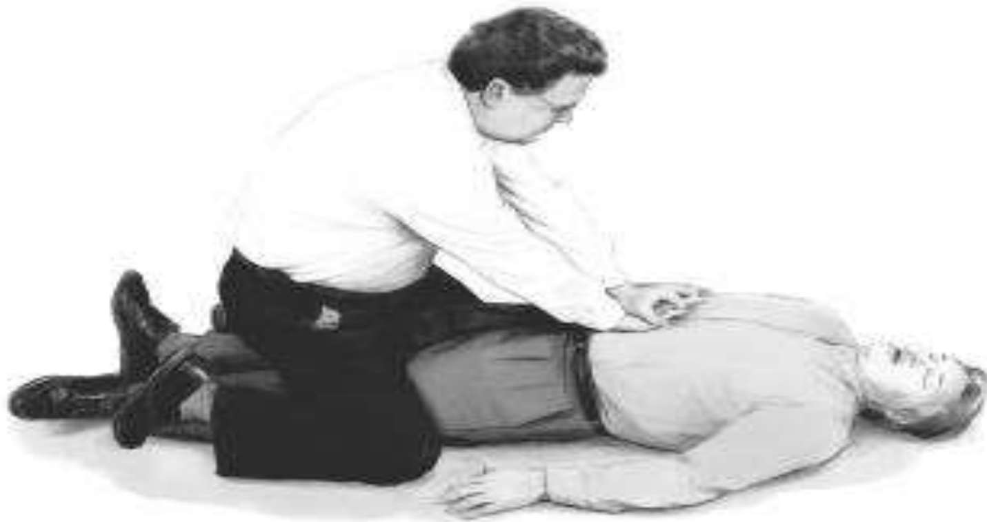
Fig. 26. Healthcare provider provision of subdiaphragmatic abdominal thrust (Heimlich maneuver) in unresponsive/unconscious victim.