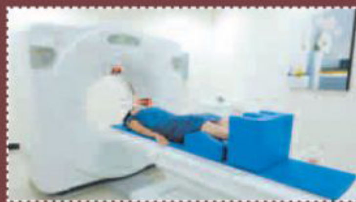
ES UN TOMÓGRAFO especializado el que se encarga de adquirir las imágenes de los tumores a tratar.