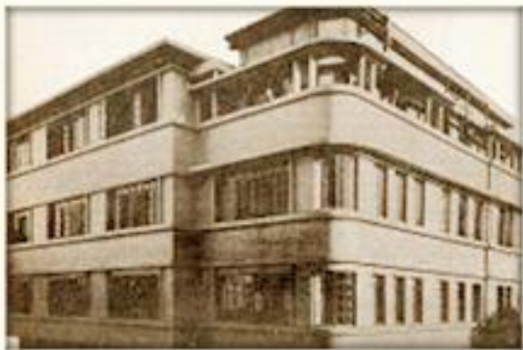
Primer edificio en donde el ISSS inicio servicios médico hospitalarios