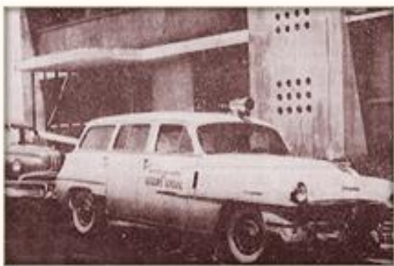
Primera ambulancia adquirida por el ISSS